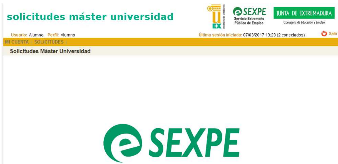
Figura 4. Página Principal

En la parte superior de la pantalla aparece el nombre del usuario autenticado en el portal y su perfil asociado. También se muestra la hora y fecha de inicio de la sesión actual.