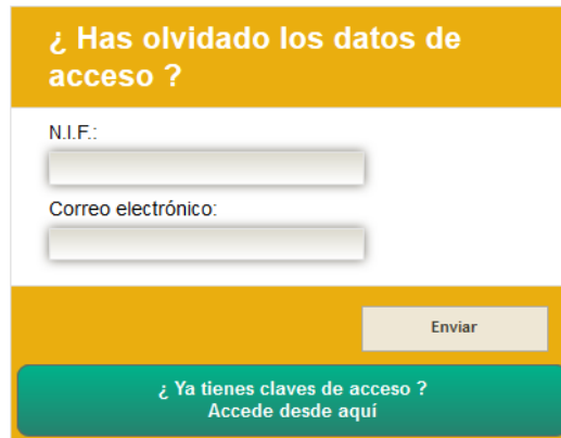
Figura 3. Generar nueva clave de acceso

Si los datos introducidos son correctos el alumno recibirá un correo electrónico para asignar una nueva clave de acceso.