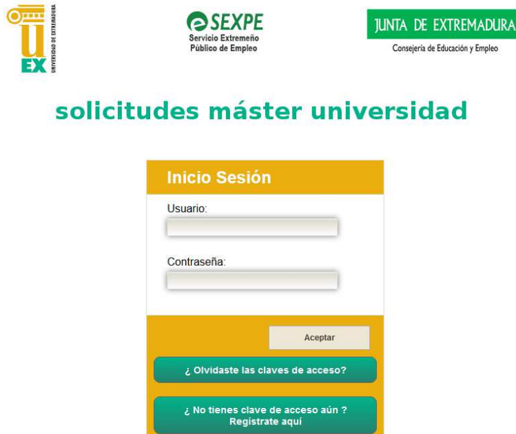
Figura 1. Página de autenticación

Debe introducir nombre de usuario y contraseña tal y como se muestra en la figura 1: