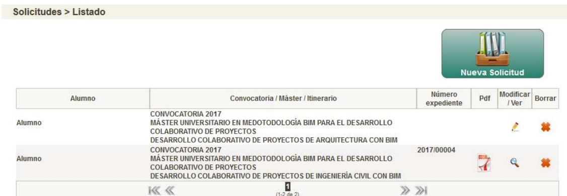
Figura 6. Listado de Másteres.

En la pantalla de solicitudes es donde se gestionan los diferentes másteres que cada alumno ha solicitado. En la figura siguiente se muestra la pantalla principal del apartado de solicitudes con un listado de todos los itinerarios solicitados por el alumno, tanto los enviados (finalizados) como no enviados.